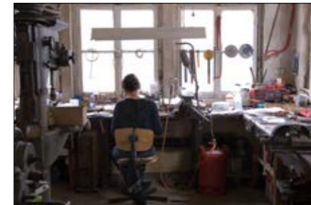
„Artist in Residence“, Industriedenkmal Jakob Bengel; Foto: Jakob Bengel-Stiftung