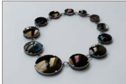
Jiro Kamata, Halschmuck „Momentopia Necklace“, 2007, Kameralinsen, Silber, Lack; Foto: Jiro Kamata

13. Dezember 2019 – 22. März 2020 in der Villa Bengel