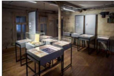
Innenansicht des Industriedenkmal Jakob Bengel, 2013; Foto: Manuel Ocaña Mascaro

15. März – 15. November 2019 im Industriedenkmal Jakob Bengel