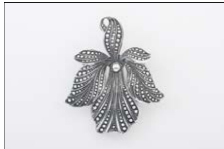
Christian Melsheimer Nachfolger, Brosche, 1957, Eloxal, Lack

15. März – 21. April 2019 in der Villa Bengel