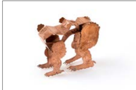
Tabea Reulecke, Objekt, 2018, Kupfer, geätzt; Foto: Qi Wang

26. April – 23. Juni 2019 in der Villa Bengel