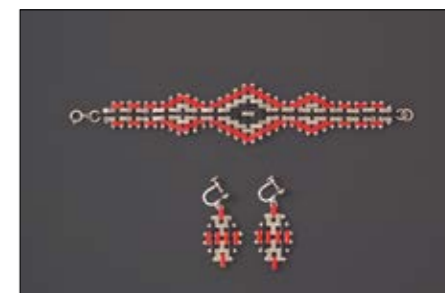
Jakob Bengel, Armband mit Ohrhängern, 1931, Messing verchromt, Lack

31. Oktober 2019 – Ende Januar 2020 im Deutschen Goldschmiedehaus Hanau