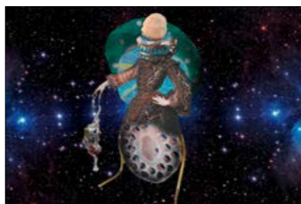
Tatjana Giorgadse, Collage „Frucht“, 2017; Foto: Tatjana Giorgadse

14. Dezember 2018 – 28. Februar 2019 in der Villa Bengel