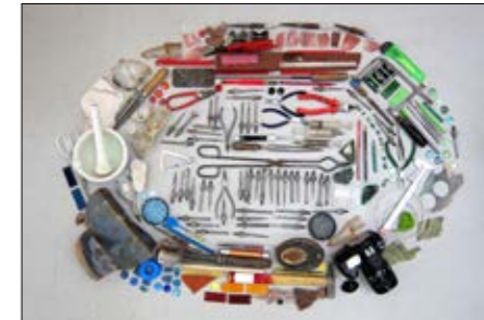
Tabea Reulecke, Collage, 2015

12. August – 23. August 2019 am Campus Idar-Oberstein